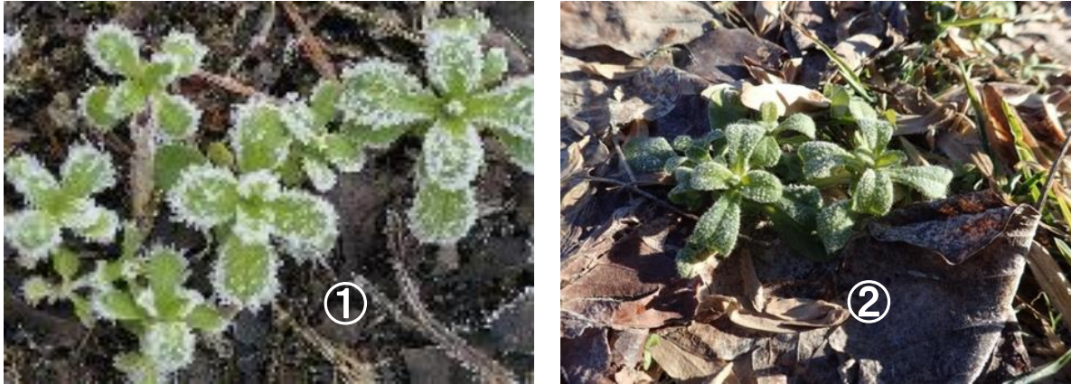
図1：凍結した植物の写真。